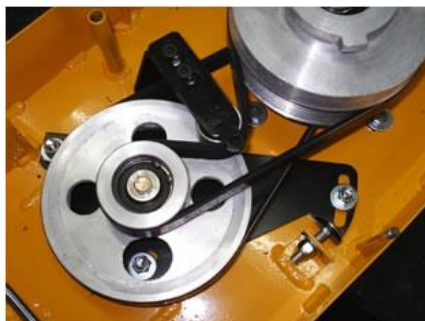
Dar tensión y fijar bulones