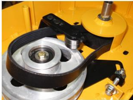
La correa inferior (6PK698) ubicada para poner motor