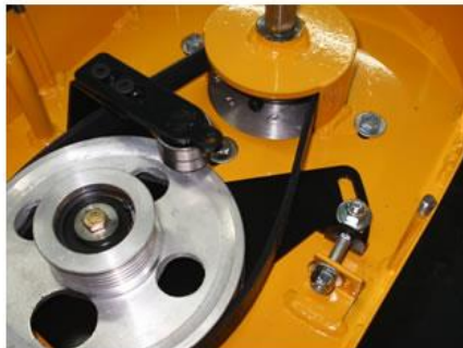
Correa ya posicionada.